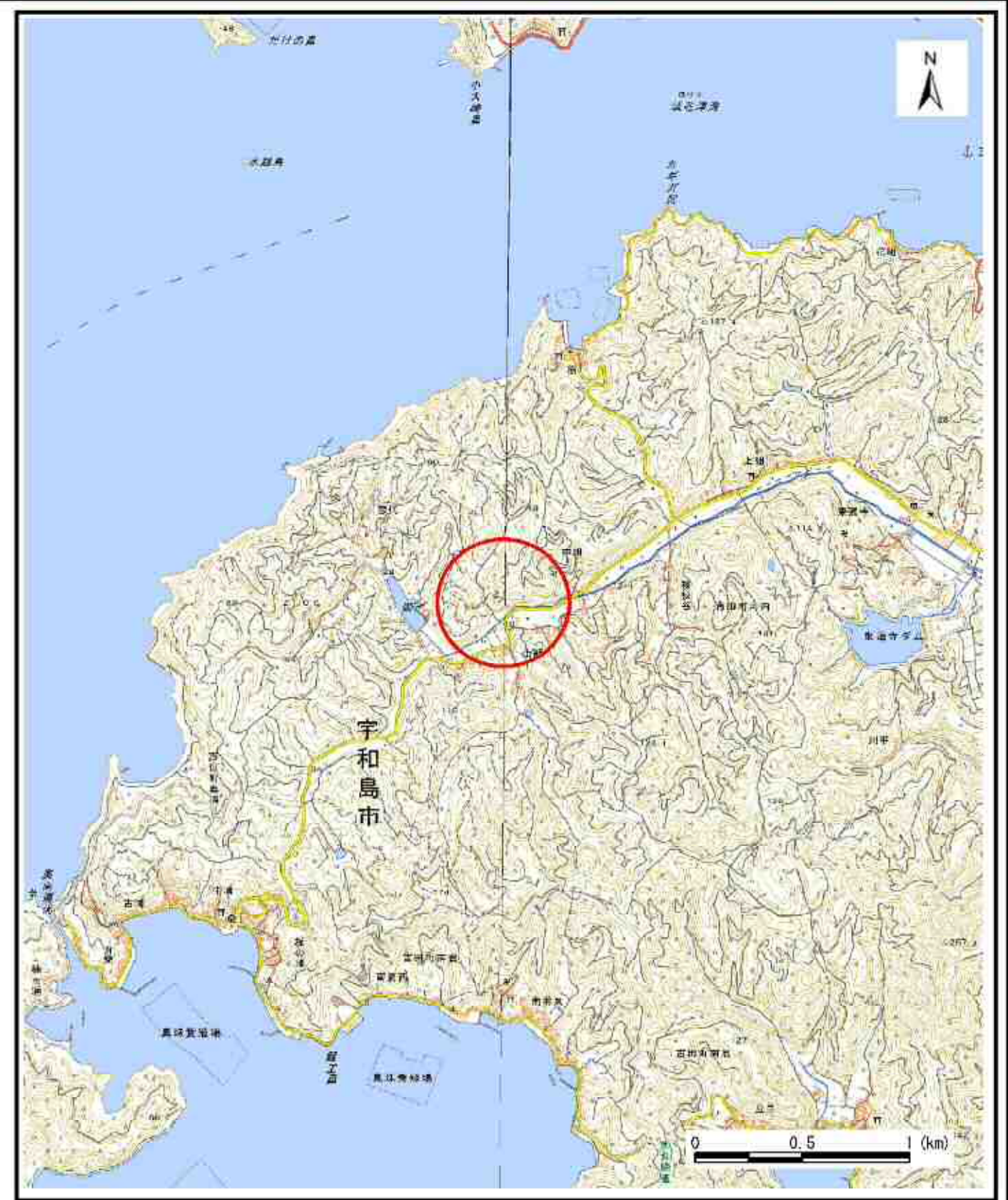
様式-1 (急) 土砂災害警戒区域・土砂災害特別警戒区域 位置図