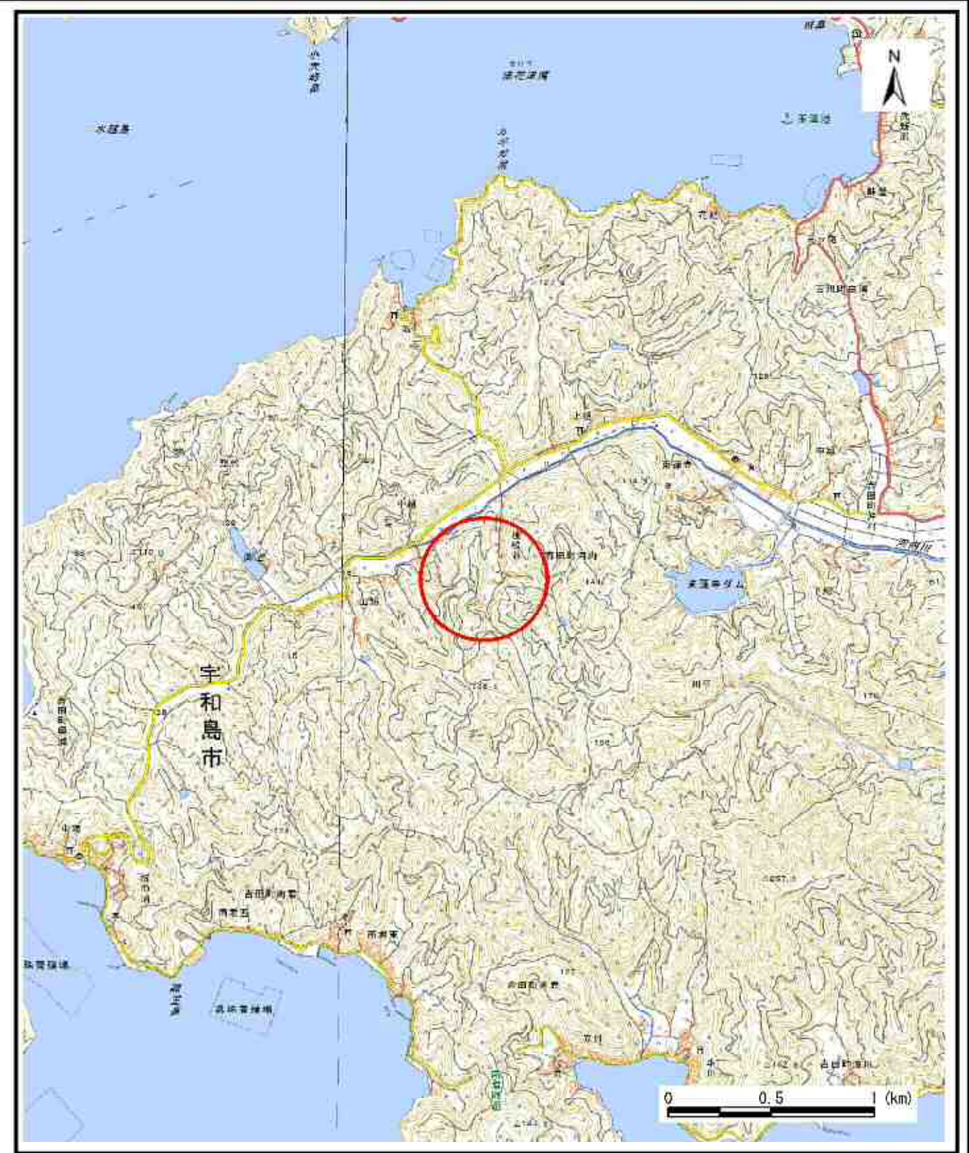
様式-1 (急) 土砂災害警戒区域・土砂災害特別警戒区域 位置図