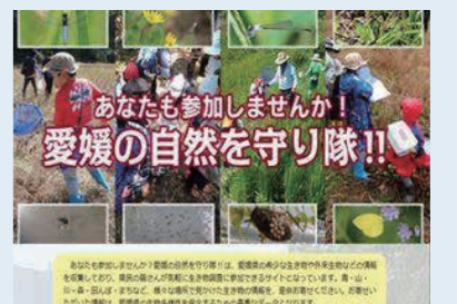
「愛媛の自然を守り隊」JHP

そのほか、外来生物や希少野生生物等に関する啓発と情報収集を行う専用ホームページ(いきもの情報・投稿専用サイト)「愛媛の自然を守り隊」を開設しました。