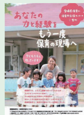
愛媛県保育士・保育所支援センター

また、27年度から新たに、保育士の役割を補完する「子育て支援員」の養成研修に取り組みました。