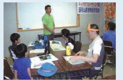
えひめいきもの応援キッズ

地域で開催する自然観察会や学習会、環境保全活動への講師の派遣のほか、「えひめいきもの応援キッズ」を募集し、生物多様性センターとそのパートナー施設(とべ動物園、愛媛県総合科学博物館、久万高原町面河山岳博物館、松野町おさかな館)を巡り、様々な視点で生物多様性を学び、生物多様性保全の意識高揚・定着を図りました。