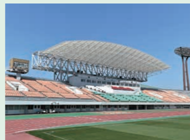
陸上競技場のメインスタンド改修

27年度は、テニスコートが供用開始となったほか、陸上競技場のメインスタンド改修、屋根設置工事が完了した結果、県総合運動公園内の国体競技施設は概ね完成となり、競技別リハーサル大会及び本番に向けて順調に準備が進んでいます。