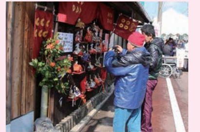
久万高原町の商店街活性化事業

愛媛県久万高原町では、県の支援を受け、「くままち商店街活性化事業」として、久万町商店街を中心に、約60か所に約1,300体のひな人形を飾り付けるとともに、店主及び近隣住民が観光客へのお接待等を行い、商店街の賑わい再生や観光客と地域住民の交流促進に取り組みました。