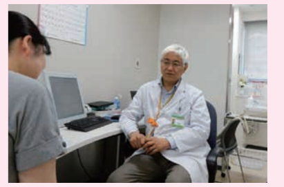
認知症疾患医療センター(愛媛大学医学部付属病院)

県では、今後急速な増加が見込まれる認知症高齢者に対する医療体制の充実を図るため、認知症疾患医療センターを県下7か所に設置・運営しており、地域における認知症医療体制の充実に取り組みました。