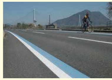
「愛媛マルゴト自転車道」ブルーラインの整備

具体的には、県下全域で26のサイクリングコースを設定し、ブルーライン、コース案内板、注意喚起標識の整備等、安全で快適なサイクリング環境の整備を行っており、今回の寄附金により、ブルーラインの整備促進を図りました。