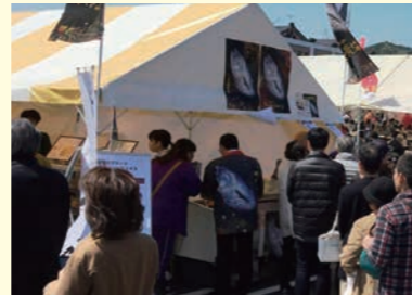
「伊予の媛貴海」販売会

ブランド化を目指し、スマを「伊予の媛貴海」とネーミングし、規格基準を決定したほか、平成28年度以降の本格的な流通販売のための準備作業として、大都市圏での試験販売、県内事業者向け商談会等を開催し、知名度向上やブランド化のためのプロモーションを実施しました。