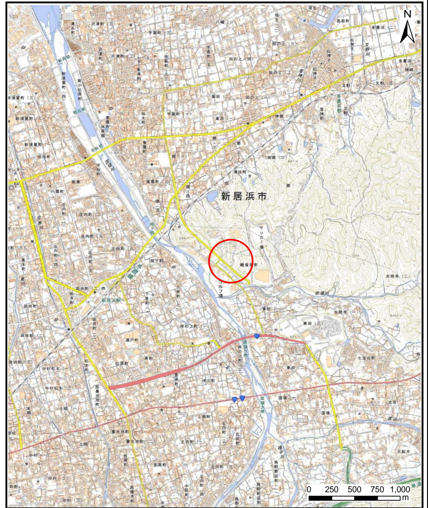
様式-1 (土) 土砂災害警戒区域・土砂災害特別警戒区域 位置図