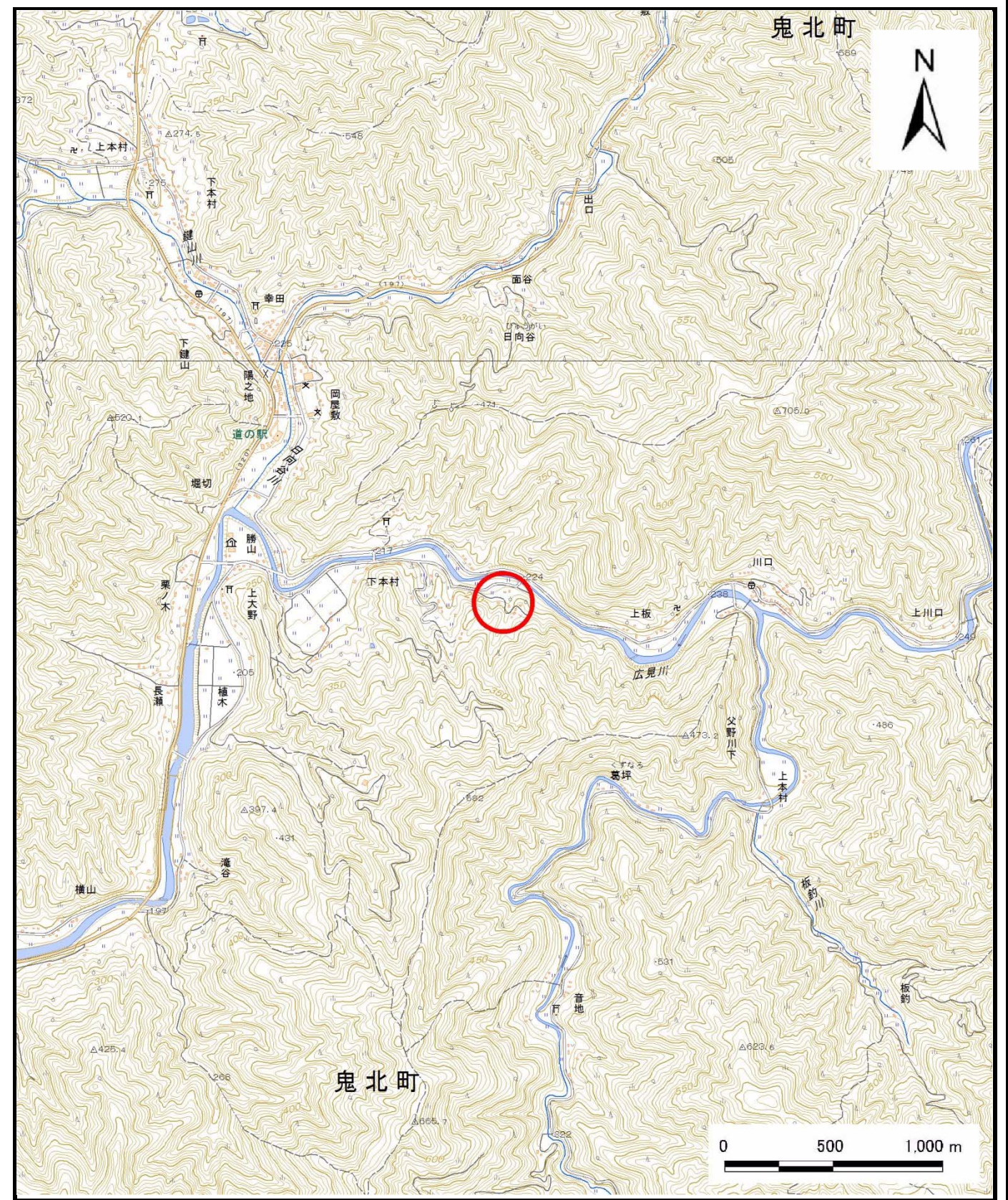
様式-1 (土) 土砂災害警戒区域・土砂災害特別警戒区域 位置図