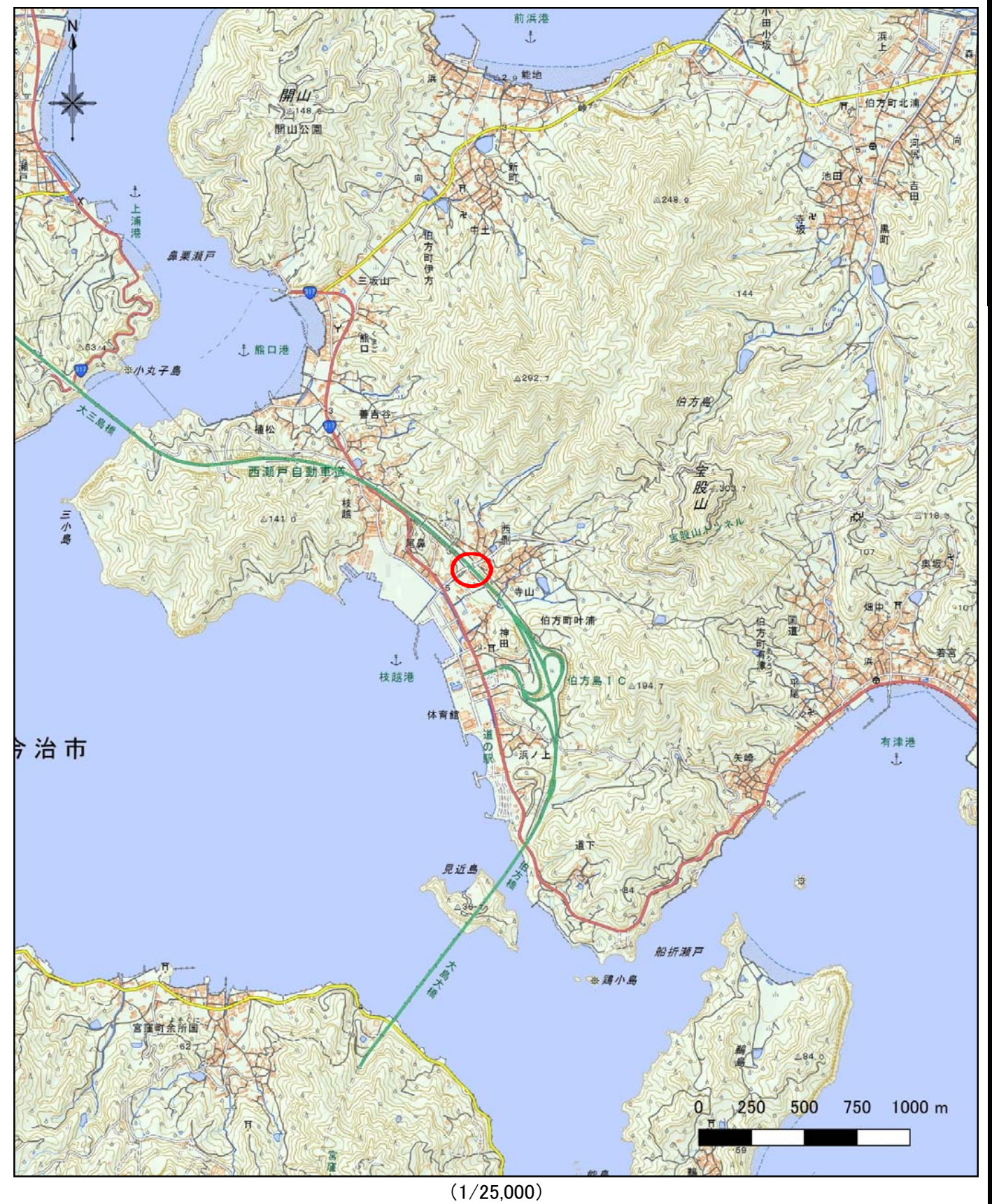
様式-1 (土) 土砂災害警戒区域・土砂災害特別警戒区域 位置図