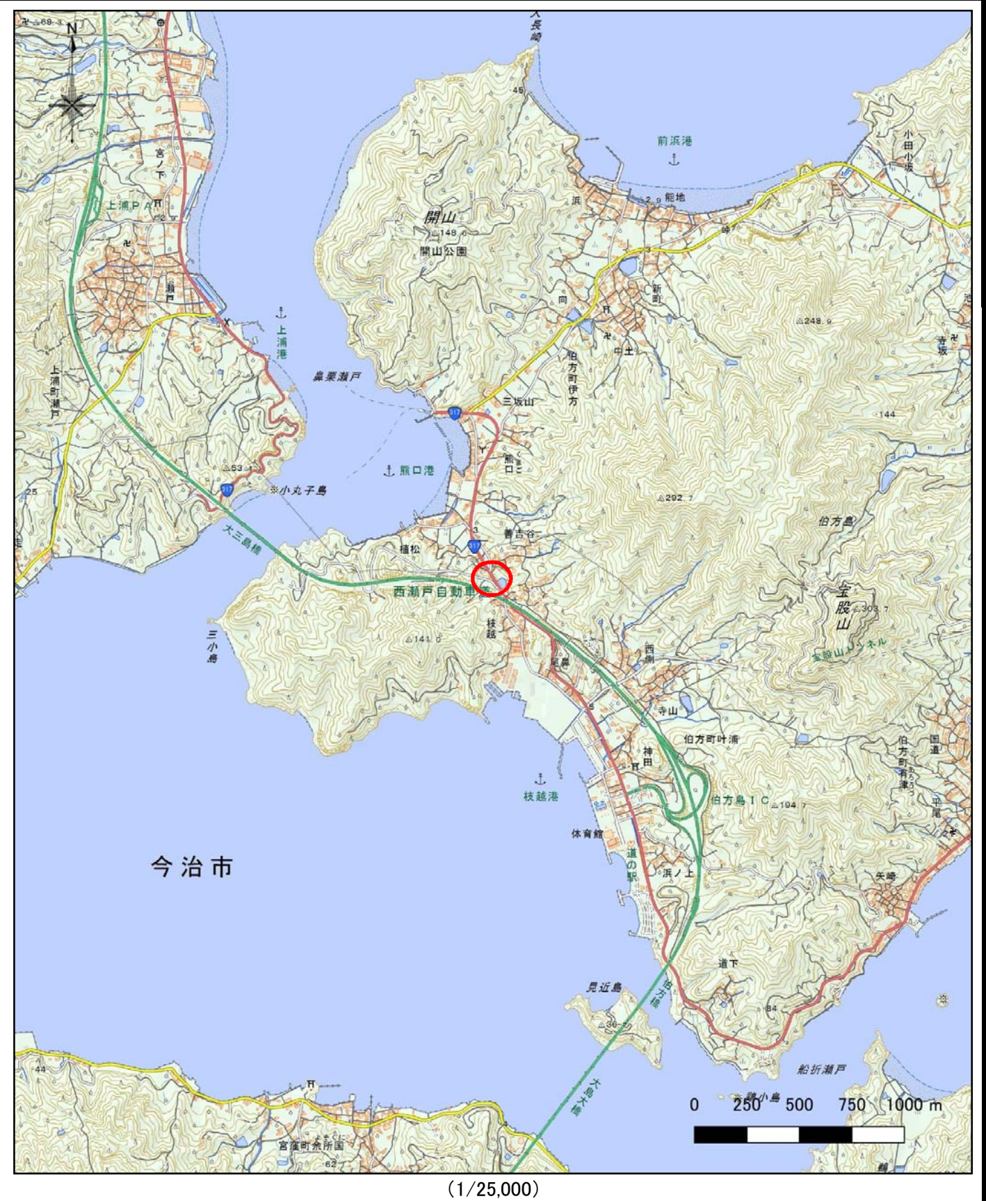
様式-1 (土) 土砂災害警戒区域・土砂災害特別警戒区域 位置図