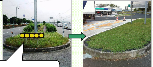
樹木がなく雑草の繁茂している部分