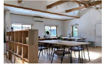
COWORKING-HUB nanyo sign (南予サイン)

愛媛県でも、新たな住まい方・働き方に着目しながら、テレワークの推進やコワーキングスペースの設置の取り組みを進めており、県内の中予・東予・南予それぞれの地域にコワーキングスペースがあります。コワーキングスペースには、テレワークするための環境はもちろんですが、似た境遇のテレワーカーが集まって、テレワーカー同士のコミュニティができ、自分の仕事に関する情報交換だけでなく、仲間と一緒に愛媛を盛り上げるためのプロジェクトがたくさん動いています。