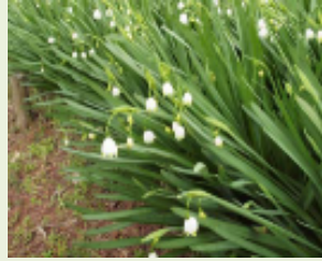
(スノーフレーク) (スズランスイセン)