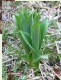
芽出し期 のコバイ ケイソウ