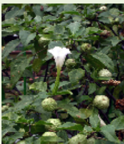
チョウセン アサガオの 葉と花