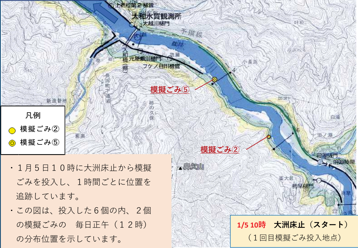
大洲河川国道事務所管内河川概要図（承認番号 平成29四複,第77号）加筆