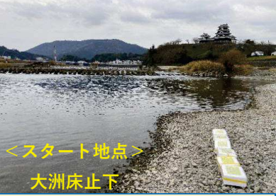
<スタート地点> 大洲床止下

1月5日10時に大洲床止から模擬ごみを投入し、1時間ごとに位置を追跡しています。