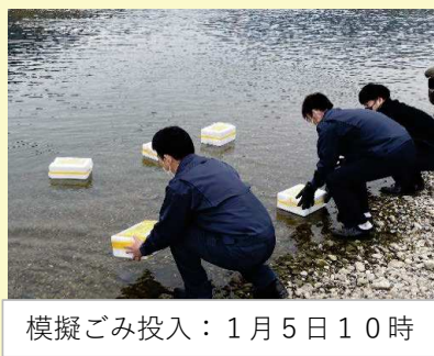
模擬ごみ投入：1月5日10時