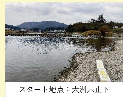
スタート地点：大洲床止下