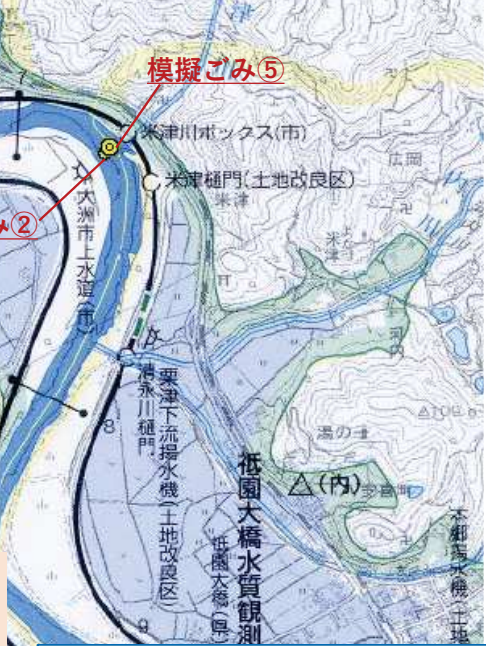
大洲河川国道事務所管内河川概要図(承認番号 平成29四複,第77号)加筆