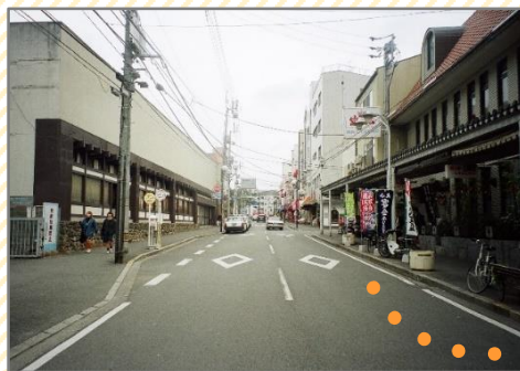
写真：愛媛県松山市 ローブウェイ街 (提供) 松山市

電柱がなくなることで、道路の見通しが良くなり、安全性・快適性が向上します。また、歩道の通行性も向上します。