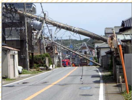
写真：令和元年台風15号による被災状況 (千葉県館山市)

電柱や電線が倒れて道路の通行を阻害することがなくなり、緊急時の避難道路として使用できます。