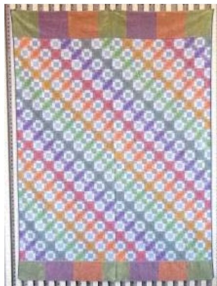
試作タオルケット

本研究により、パイル部分に3色毛違い組織を使用し、地部分に明度差を表現する織組織の開発を行うことで、新しい製織技術・デザイン手法を確立しました。また、この技術を他の商品に応用することによる新たな差別化商品開発の可能性が開けました。