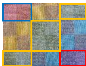
パイル柄と地柄の併用による色彩効果