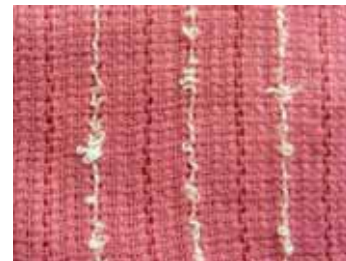
軽量薄地タオルマフラー生地