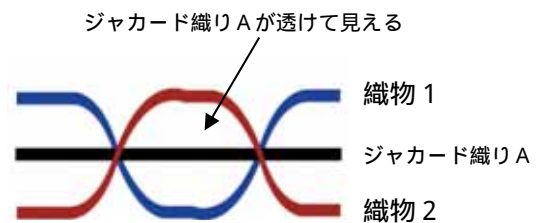
3重ジャカード織りタオルマフラー生地

透け感を活かした多様な色彩効果を持つ 3重ジャカード織り は、絹やポリエステルなど 細い繊維を使用した織物 ではよく見ることができませんが、それよりも太い繊維である 綿糸 を使用するタオルマフラーにおいても有効であることが確認できました。