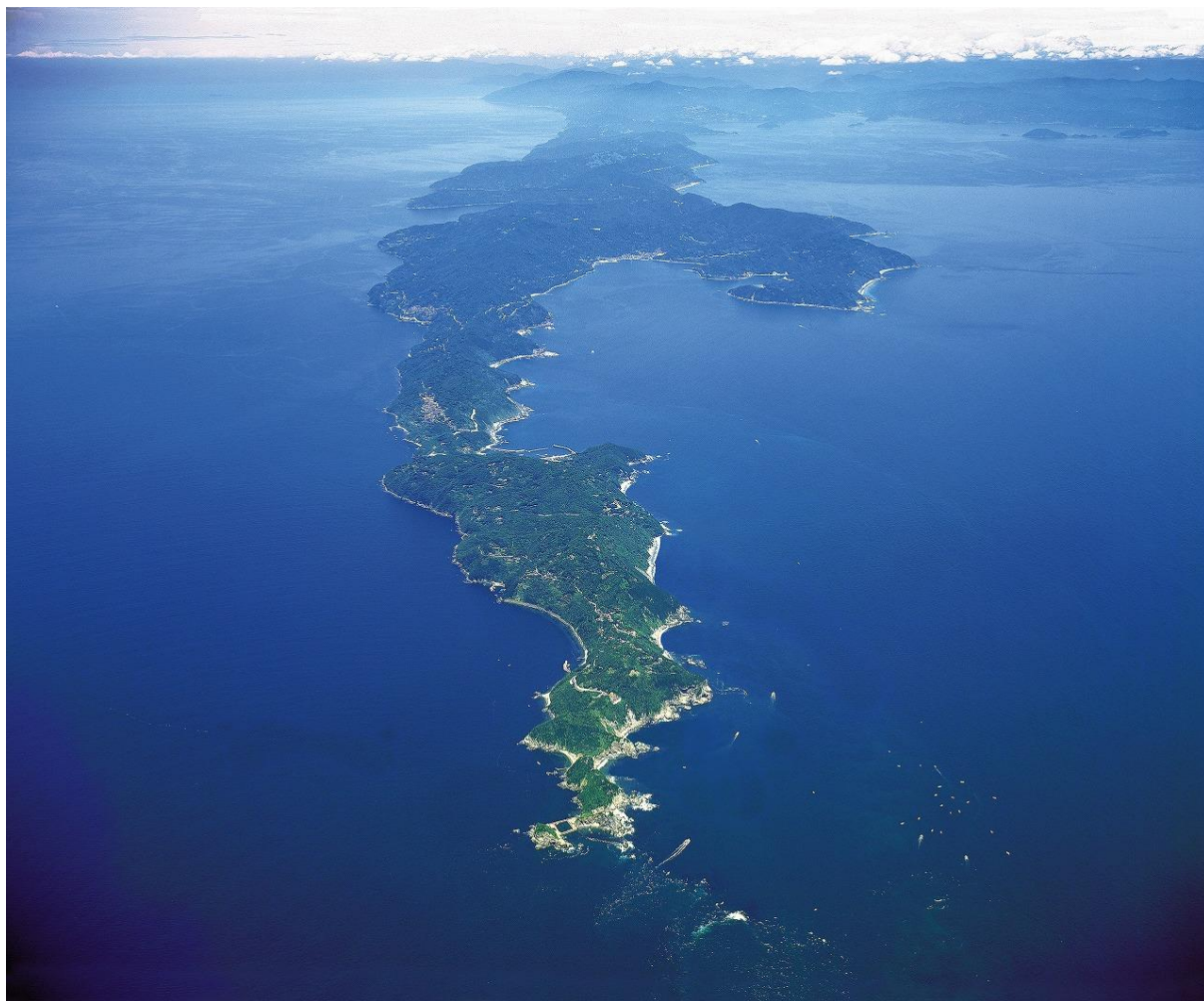
〔佐田岬半島航空写真図〕