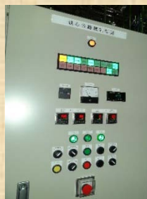
入れ替えた加工場内の機器類