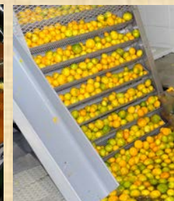
1日100トンのみかんを加工