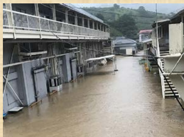
裏山から流れてきた泥水