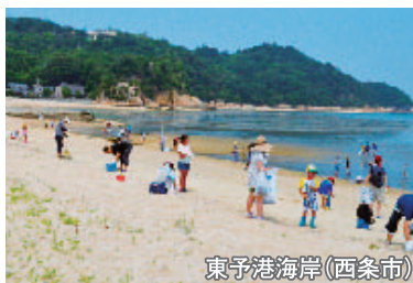
東予港海岸(西条市)

県が管理する河川・海岸・道路の清掃美化活動を自発的に行うボランティア団体等に対し、作業用具の貸与、ゴミ運搬車両の借り上げ等の支援を行い、県民と行政とのパートナーシップを基本に美しい地域環境を創り出していきます。