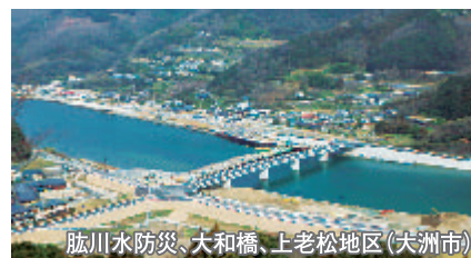
肱川水防災、大和橋、上老松地区(大洲市)

河川事業(国)、道路事業(県)及び土地区画整理事業(市)の各事業の連携により、宅地嵩上げ方式による改修を実施し、早期に浸水被害を解消するとともに、安心して安全な道路環境、快適な住環境の整備を図ります。