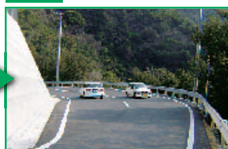
一般県道網代鳥越線(愛南町)