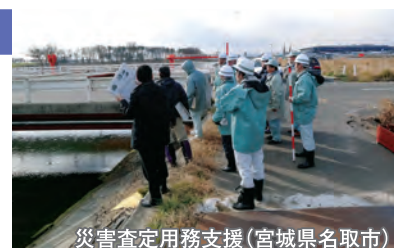
災害査定用務支援(宮城県名取市)