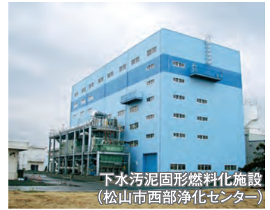
下水汚泥固形燃料化施設(松山市西部浄化センター)

トイレの水洗化といった生活環境の改善、河川・海域などの公共用水域の水質保全、市街地の浸水対策に加え、下水汚泥の有効利用など、下水道の整備を推進します。