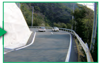
一般県道網代鳥越線（愛南町）