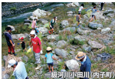
一級河川小田川（内子町）

県が管理する河川・海岸・道路の清掃美化活動を自発的に行うボランティア団体等に対し、作業用具の貸与、ゴミ運搬車両の借り上げ等の支援を行い、県民と行政とのパートナーシップを基本に美しい地域環境を創り出していきます。