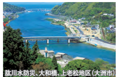
肱川水防災、大和橋、上老松地区（大洲市）

河川事業（国）、道路事業（県）及び土地区画整理事業（市）の各事業の連携により、宅地高上げ方式による改修を実施し、早期に浸水被害を解消するとともに、安心して安全な道路環境、快適な住環境の整備を図ります。