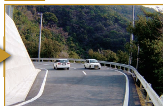
一般県道網代鳥越線(愛南町)