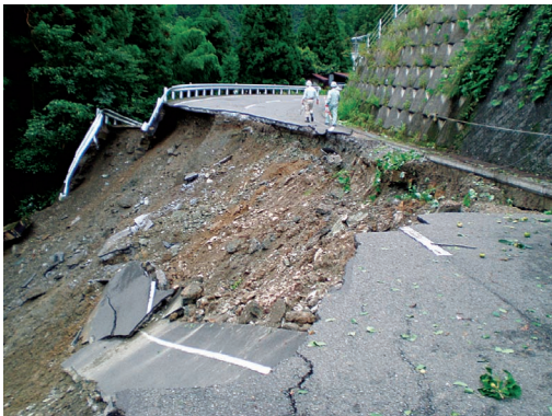
平成23年台風第12号(西条市)