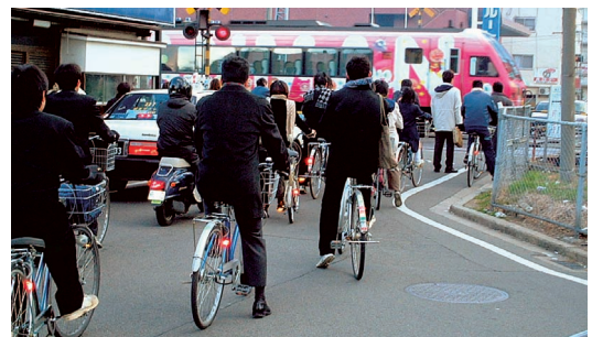
南江戸踏切(松山市)

高速交通体系の整備推進にともない、県民生活や経済活動の広域化と利便性が図られる中、県境を越えた都市間競争に対応するため、渋滞緩和や主要施設とのアクセス向上等の都市内交通の円滑化や、快適で賑わいのある魅力あるまちづくりなど、都市の機能強化に取り組むことが必要となっています。