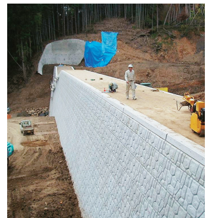
サルガタケ川(鬼北町)

砂防えん堤において、現地発生土をセメントで改良し、えん堤の中詰材として再利用(INSEM-DW)することにより、残土運搬コストの削減など工事コストの削減と環境負荷の低減を図ります。