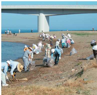
地元住民による長浜港海岸(大洲市)の清掃活動

県が管理する河川・海岸・道路の清掃美化活動を自発的に行うボランティア団体等に対し、作業用具の貸与、ゴミ運搬車両の借り上げ等の支援を行い、県民と行政とのパートナーシップを基本に美しい地域環境を創り出していきます。