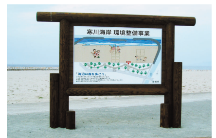
寒川海岸(四国中央市)

景観や環境保全上、木材の使用が望ましい箇所や工用看板や現場立入防護柵等、強度や耐久性の問題が比較的少ない箇所において間伐材の積極的な利用を図ります。