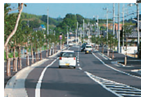
一般県道今治丹原線

今治新都市開発と連携した一般県道今治丹原線の整備及び浅川の改修など事業間で連携して、効率的・一体的な整備を推進します。