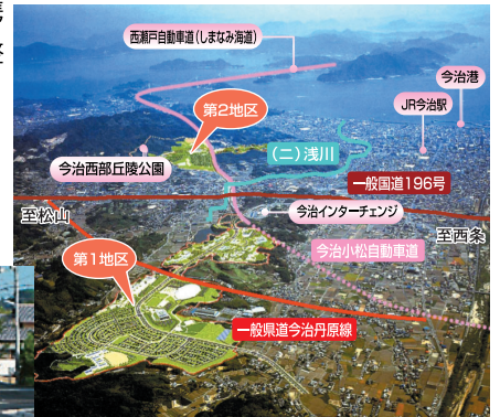
今治新都市との連携(今治市)