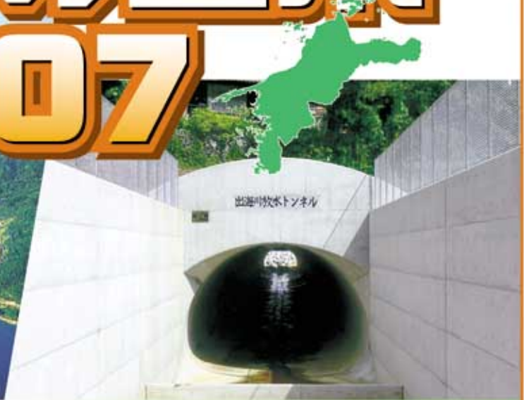
出海川放水路 (大洲市)