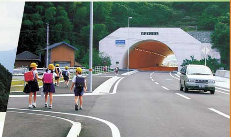
(国)378号 伊津バイパス (宇和島市)