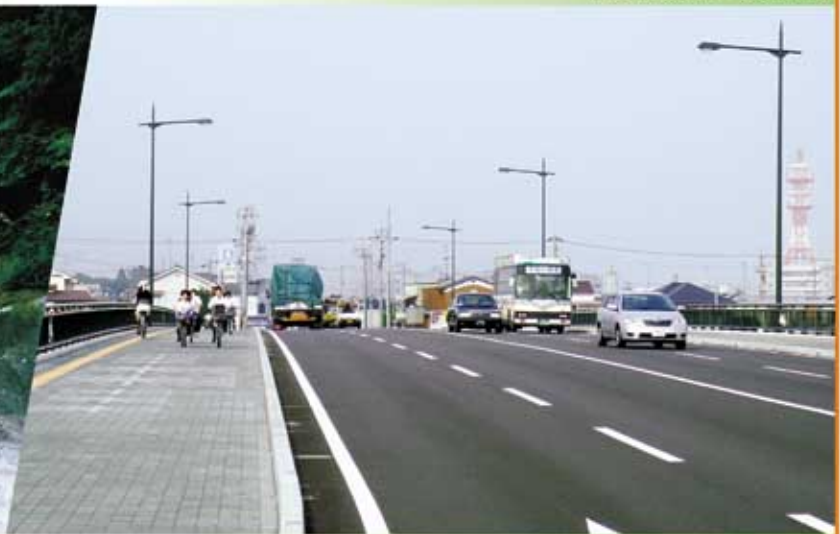
平形橋 (都)船屋阿島線 (新居浜市)