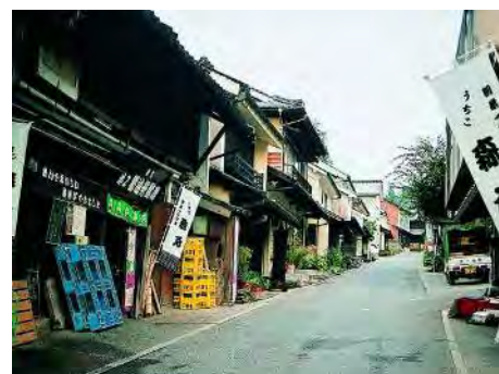
【内子町の町並みと和ろうそく】