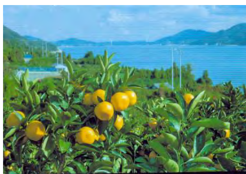
【西宇和の温州みかん】

この事業に本県からは、「愛媛西宇和の温州みかん」（愛媛県）、「西条王至森寺の金木屋 さいじょうおうしもりじ きんもくせい 」（西条市）、「内子町の町並みと和ろうそく」（内子町）の3件が認定された。