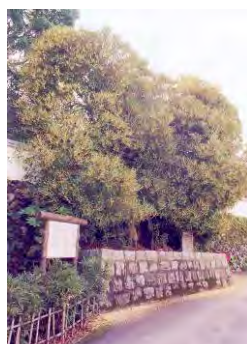
【西条王至森寺の金木屋】