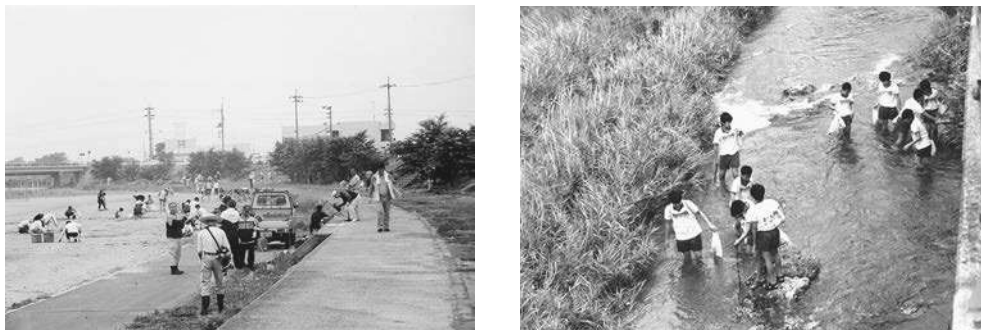
【愛リバー・サポーター清掃美化活動】

平成12年度の制度創設以来、29年度末現在で県下20市町の107河川で262団体を認定し、各団体において清掃美化活動等が実施されており、各団体の構成員総数は17,989人、サポーター区間延長は約188kmにも及んでいる。