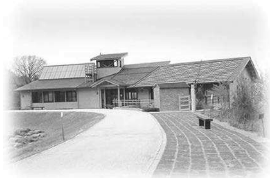
【えひめエコ・ハウス全景】

指定管理者制度の導入に伴い、平成 18 年 4 月からは、伊予鉄総合企画株式会社（旧社名：イヨテツケーターサービス株式会社）に管理、運営を委託している。