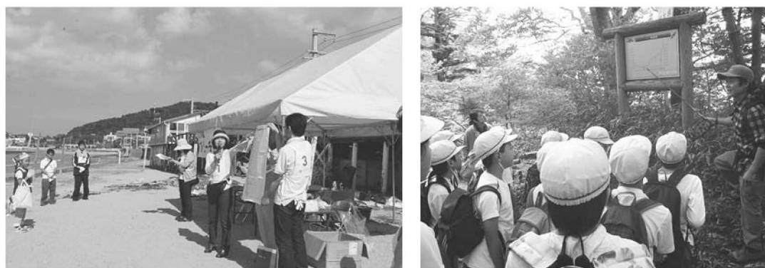
【環境マイスター活動状況】