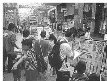
【都市イベントの様子】