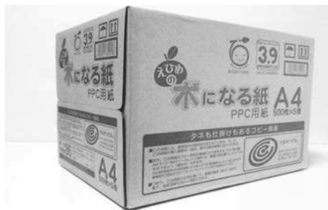
【えひめの木になる紙】

また、大王製紙(株)を中心に森林組合やチップ加工業者らで構成する「えひめの木になる紙生産推進グループ」が、県産間伐材を利用したコピー用紙を（「えひめの木になる紙」）平成25年4月から販売しており、30年3月末までに34,632箱（売上高：64,105,220円）を販売した。