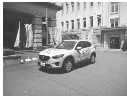
【バイオディーゼル燃料普及啓発車両】