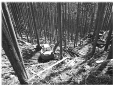
【高性能林業機械による 森林整備】

さらに、近年、ゲリラと呼ばれる集中豪雨により、県下でも山地災害が増加傾向にある中、被災した森林を早期に回復させるため、治山事業による施設整備を実施するほか、重要な水源地域や山地災害危険地区においては、森林の水源かん養機能や土砂流出防止機能等を高めるための森林整備を実施している。