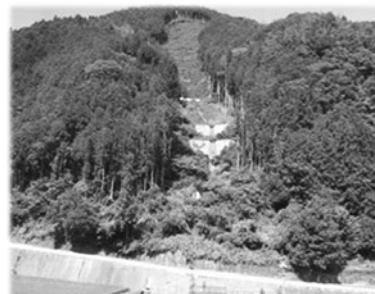
【山地災害跡地への 治山施設整備】