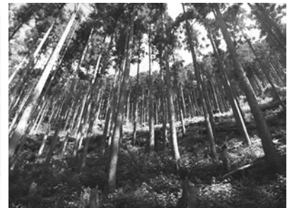
【森林の多面的機能を 高める整備】