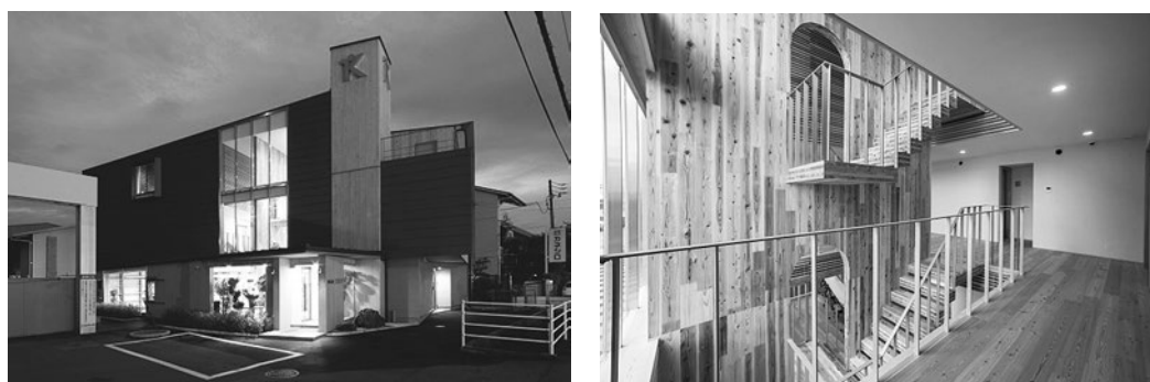
【愛媛県内初の CLT を利用した事務所(松山市)】

さらに、平成 27 年度からは、木材を大量に使用する新たな建築資材として注目されている CLT (Cross Laminated Timber) の普及や実証展示施設の建設等に支援を行い、新たな利用用途の確保に努めている。