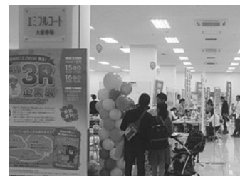
【「愛媛の3R企業展」開催状況】