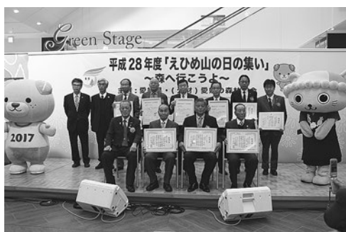
【えひめ山の日の集い】

当取り組みでは、森林に対する理解と保全活動への県民参加を促進する目的で、毎年、多くの県民の参加を得て「えひめ山の日の集い」を開催するとともに、ホームページや新聞広告等による啓蒙・普及を行った。また、森林保全等への県民自発的な参加を進めるため、市町や県民からの提案型公募事業に対する支援を行った。