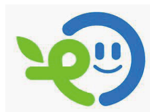
【愛媛県資源循環優良 モデルシンボルマーク】