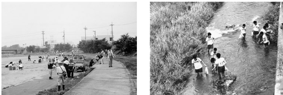
【愛リバー・サポーター清掃美化活動】

平成12年度の制度創設以来、28年度末現在で県下20市町の108河川で255団体を認定し、各団体において清掃美化活動等が実施されており、各団体の構成員総数は17,832人、サポーター区間延長は約184kmにも及んでいる。