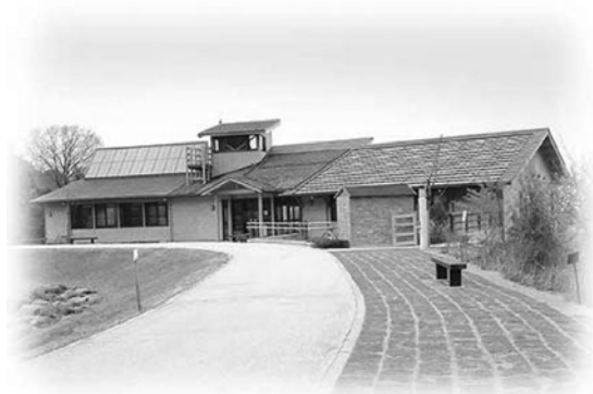
【えひめエコ・ハウス全景】

指定管理者制度の導入に伴い、平成 18 年 4 月からは、伊予鉄総合企画株式会社（旧社名：イヨテツケーターサービス株式会社）に管理、運営を委託している。