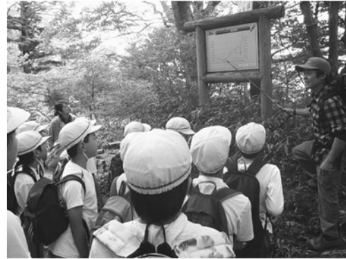
【環境マイスター活動状況】