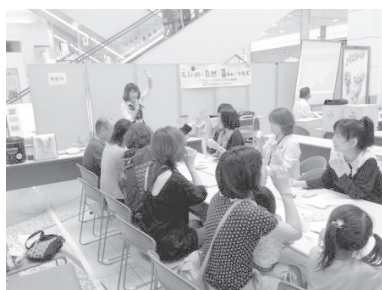
平成25年度生物多様性を普及啓発するためのワークショップ等開催状況