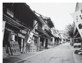
内子町の町並みと和ろうそく