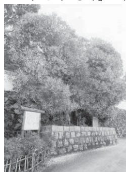
西条王至森寺の金木屋