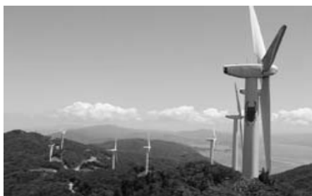
伊方町の風力発電施設