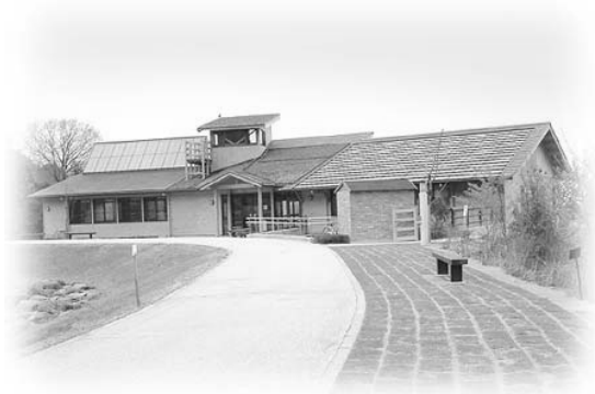
えひめエコ・ハウス全景