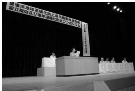
〔愛媛県地球温暖化防止県民運動推進会議設立総会〕

県では、同会議を核として、企業や団体、自治体など、各主体間での情報交換や連携を密にし、より効果的な温暖化対策を推進しており、家庭・オフィス・工場・運輸などの各部門においても、適正な冷暖房温度の設定、クールビズ、エコドライブなど、温暖化防止に向けた身近なところからの取組が進められている。