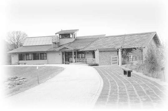
えひめエコ・ハウス全景