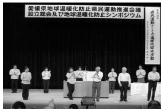
〔愛媛県地球温暖化防止県民運動推進会議設立総会〕