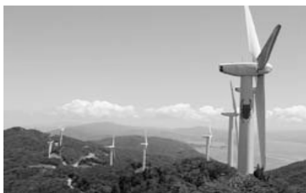
伊方町の風力発電施設