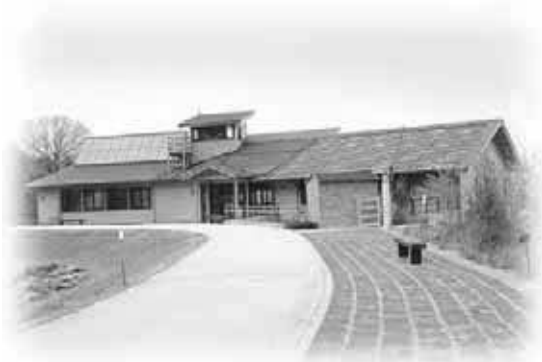
えひめエコ・ハウス全景

なお、指定管理者制度の導入に伴い、平成18年4月からは、イヨテツケーターサービス株式会社に管理、運営を委託している。