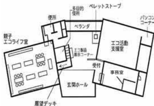
えひめエコ・ハウス平面図