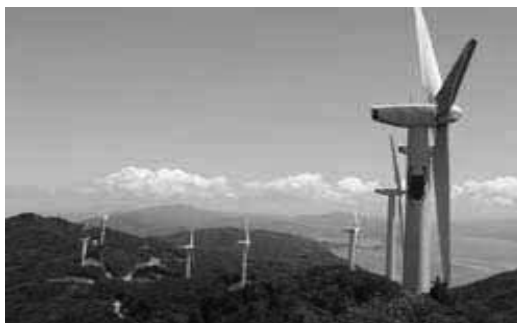
伊方町の風力発電施設