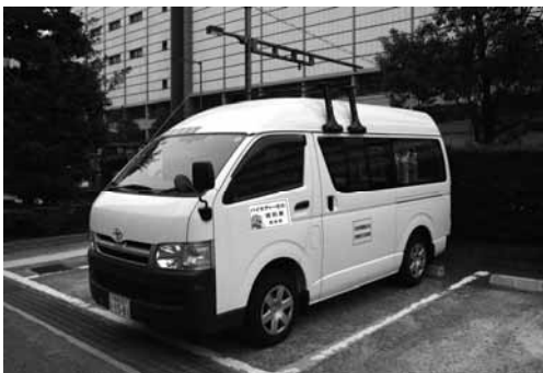
衛生環境研究所公害測定車

また、県においても、平成 19 年 11 月から、ヒマワリ油から製造した BDF5%混合軽油を衛生環境研究所の公害測定車の燃料として使用している。