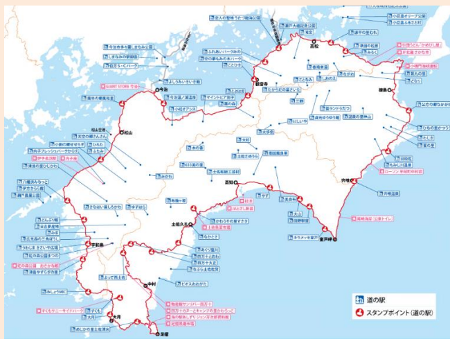
四国一周サイクリングルートマップ