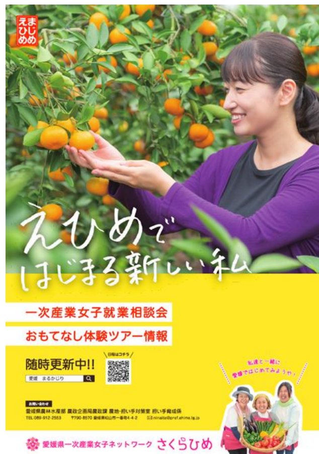
図2 体験ツアー案内ポスター