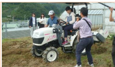
女性向けトラクタによる機械操作ゼミ