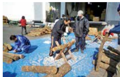
原木しいたけ生産者生産実習