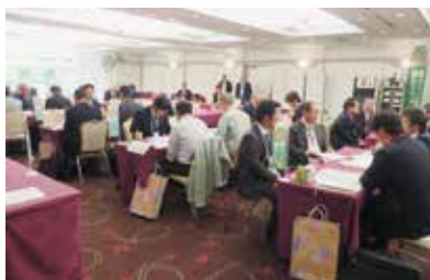
マッチング商談会