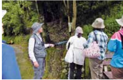
樹木を活用した自然観察会