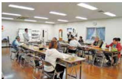
原木しいたけ生産技術向上研修会