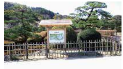
南レク公園 案内看板