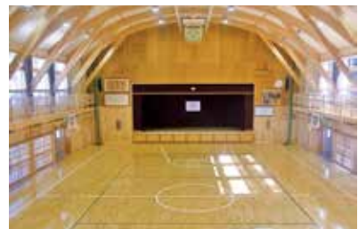
松蔭小学校 屋内運動場