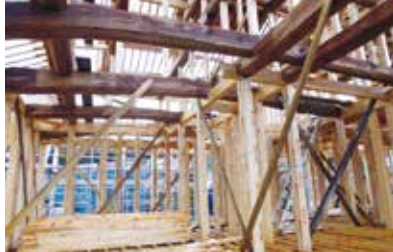
えひめ材の家づくり促進支援事業