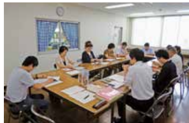
販路開拓に係る検討会

県産原木乾しいたけの新規販路を開拓するとともに、トレーサビリティ電子化の成果を活用した安全性をPRしました。