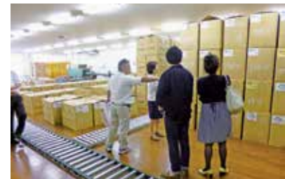
県産原木乾しいたけの説明