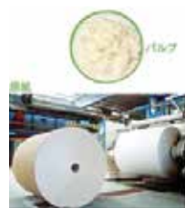
パルプや原紙に加工