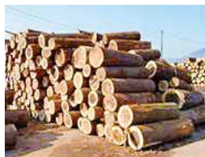
搬出・利用を促進