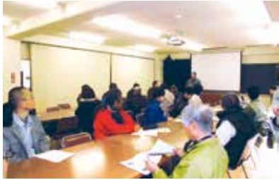
チェーンソーの研修

森林づくりを行う青少年の活動支援を行うとともに、その指導者の育成研修を行いました。森林ボランティア等に安全教育・技術研修を行い、県民の森林づくり活動を支援しました。