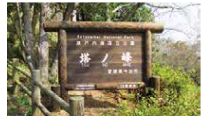
瀬戸内海国立公園