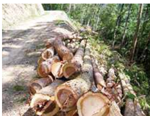
森林整備後放置された低質材