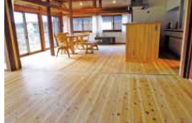
住宅等リフォーム木材利用促進事業