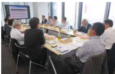
知事によるトップセールス