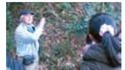
36 NPO 法人 自然環境教育えことのは 森の時間その 11