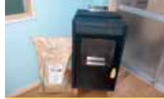
4 西予市 西予市産木質パレット生産利活用