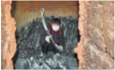
45 脇川中学校PTA 炭焼き体験学習