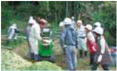
44 伯方町女性林業研究グループ 自然とのふれあい事業