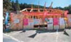
28 久万材の家づくり推進協議会 地域材木造住宅「ささゆりの家」展示