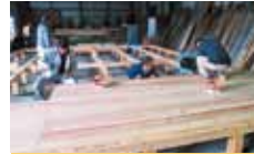
27 愛媛木材青年協議会 森づくりの基地からの発信～木魂の挑戦～