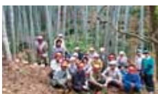
6 NPO 法人 倫理生活指導センター 竹林整備及び竹細工体験