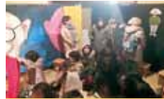
18 NPO 法人 QaCoA (カコア) 木造建築物と木材に親しむコミュニティギャラリー