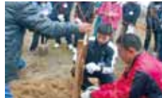
12 えんとつ山倶楽部 「えんとつ山」里山整備