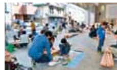
31 八西林業研究グループ 親子木工広場