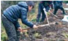
3 認可地縁団体 氷見公益会 氷見水源の森づくり