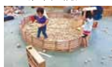
25 はびニコくらぶ 木のおもちゃと触れあおう