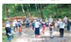
17 かくや姫 竹林整備の体験学習と環境教育