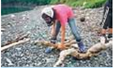
43 愛南町立長月小学校 長月夢の森づくり