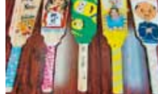
19 八幡浜市立松陰地区公民館 地域ふれあい交流会活動