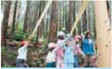
42 プロジェクト地球つ子ひろば 親子で生き物とふれあう森づくり