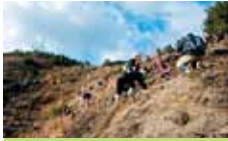
1 今治市 笠松山火災跡地復旧