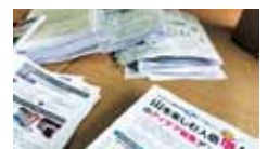
38 もりのわ 地域資源発掘対策に関する方向性を考える