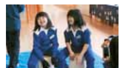
39 上浮穴高校森林環境科農業クラブ 地元産材を活用した森林・環境教育