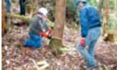
2 滑床千年の森をつくる会 滑床ふれあいの森