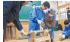
29 上浮穴林研グループ連絡協議会 森と木のふれあい講座