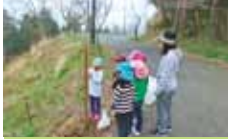
2 上島町 横善山の桜保全事業