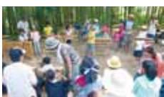
7 竹林をよくする会 竹利用による竹林の整備