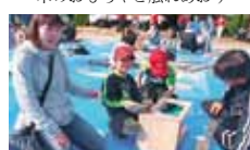
26 南宇和地区林業振興会議 親子手作り木工広場