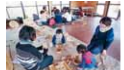
35 Hug 育 (ハグハグ) 森の木育ひろば 2015