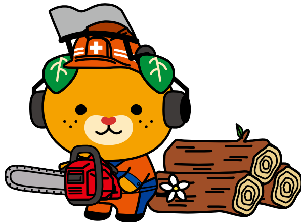
愛媛県イメージアップ キャラクター みぎやん