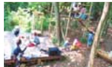
21 NPO 法人 松山冒険遊び場 子どもたちと森をつなぐプレーパーク