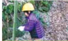
10 NPO 法人 INVISIBLE 「持続可能な協働の竹林づくり」プロジェクト