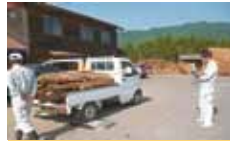
5 内子町 木こり市場プロジェクト