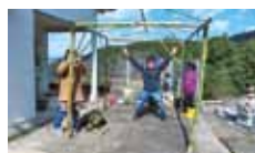
15 もりのわ 上林里山整備プロジェクト