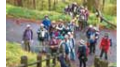
34 えひめ森の案内人会 森への誘い推進事業