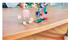
24 NPO 法人 自然環境教育えことのは 五明っ子木工体験ひろば