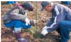
4 宮内財産区 宮内財産区の森整備活動