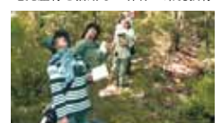
40 さんきら自然塾 神南山「生物多様性の森」保全 PROJECT