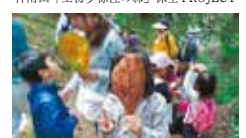
41 森林・自然体験活動連絡会 森林・自然体験活動推進事業