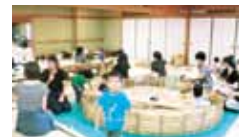
37 どんぐり倶楽部 木を体感して、木や自然を知る