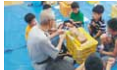
20 NPO 法人 JMACS 遊友学舎 木工教室