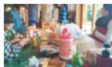
23 NPO こところ言葉と香りのリラクゼーション 森の香りクラフト体験