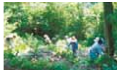
13 えひめ森の案内人会 森をつくり育てる活動