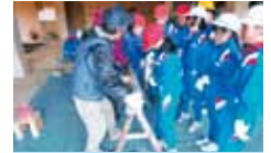
33 夢遊友ずい 森林環境教育