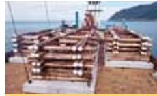
3 伊方町 木製増殖礁設置事業