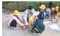
22 愛媛県森林組合職員連盟本会支部 森とふれあう教室