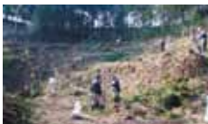
5 森の国さくらの森 森の国さくらの里づくり