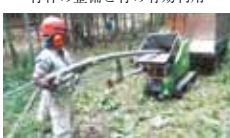
9 市場里山ボランティア会 竹林と遊歩道整備・湿原復活活動