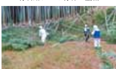
8 高知里山を愛する会 竹林の整備と竹の有効利用