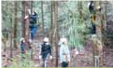
1 えひめ学生森林ボランティア えひめ学生の森づくり