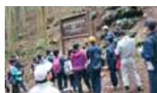
16 四国中央林研グループ連絡協議会 新宮小中学校林の整備