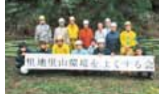
11 里地里山環境をよくする会 竹林の整備と竹の有効活用