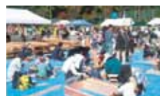
32 久万林業まつり実行委員会 久万林業まつり親子木工広場