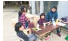
30 NPO 法人 今治シビックプライドセンター まちなか木材ふれあい事業