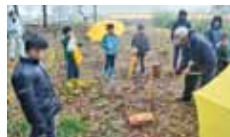
14 いやしの森づくり推進会 いやしの森づくり