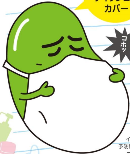
インフルエンザ 予防啓発キャラクター マメゾウくん