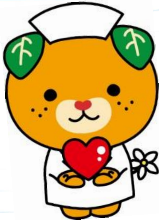
愛媛県イメージアップキャラクター みきゃん