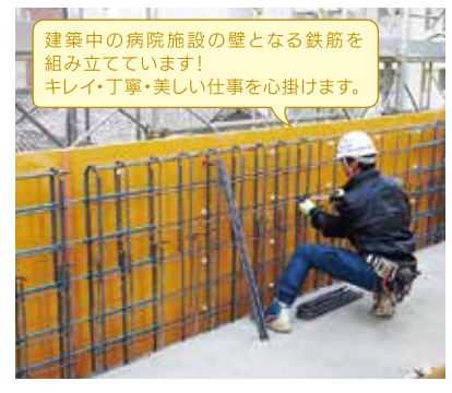
建築中の病院施設の壁となる鉄筋を組み立てています! キレイ・丁寧・美しい仕事を心掛けます。

入社して初めての現場である愛媛県立中央病院の建設工事です。初めての現場で何をやるにも分からないことだらけでしたが、先輩の職人さんと二人一組になって、から教えてもらいつつ、簡単な作業から始めていきました。