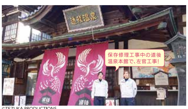
保存修理工事中の道後温泉本館で、左官工事!

左官と聞いて一番イメージしやすいのは、建物の壁をきれいに塗り上げる仕事かと思いますが、それだけではなく、床のコンクリートを平らにならす仕上作業や駐車場のスロープ、階段など左官工事の幅は広く、建築工事の最初から最後の仕上げまでに関わる重要な仕事です。