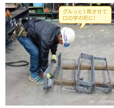
グルッと1周させて口の字の形に!

現場の責任者・リーダーとして、工事に必要な鉄筋の長さ、形状、本数等を計算し、図面を作成する拾い出しと言う作業から現場での組み立てまで、一連の作業を全部自分で出来るようになるのが今の目標です。住宅の基礎から始めて、アパート、マンションなど、経験を積み、日々勉強しながらどんどん大きな建物の建設工事にチャレンジしていきたいと思っています。