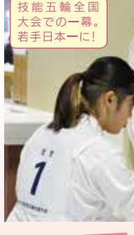
技能五輪全国大会での一幕。若手日本一に!