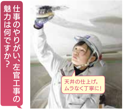
天井の仕上げ。ムラなく丁寧に!