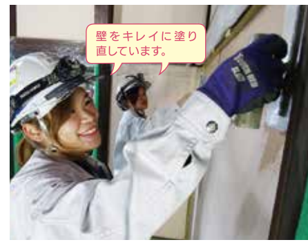
壁をキレイに塗り直しています。

私たちの仕事はチームワークがすごく大事なので、周りの人を見て、この人が次こういう仕事をするから、私はこれをしていいかなとか、一緒に仕事をしている人たちがスムーズに仕事ができるように考えながら行動することを心掛けています。