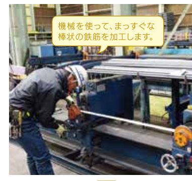
機械を使って、まっすぐな棒状の鉄筋を加工します。

社員の皆さんと会社全体の距離感がすごく近くて、何でも話せて相談もできる、仲の良い職場なところだ。入社する前は、少し怖いかなというイメージもありましたが、先輩の皆さんもすごく優しく、分からないことを質問したら何でも答えてくれて、仕事に前向きな職人さんが多く、和気あいあいとした雰囲気です。