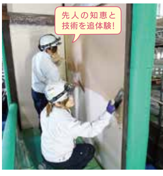
先人の知恵と技術を体験!