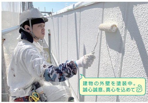
建物の外壁を塗装中。 誠心誠意、真心を込めて。

私たちの会社では建物への塗装の他に、机や椅子、ドアといった家具の塗り替え塗装も行っています。