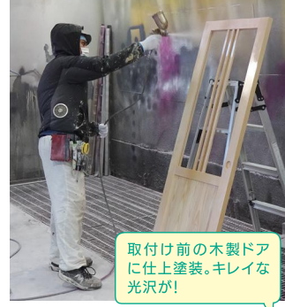
取付け前の木製ドアに仕上げ塗装。キレイな光沢が！