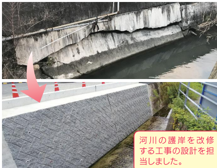
河川の護岸を改修する工事の設計を担当しました。