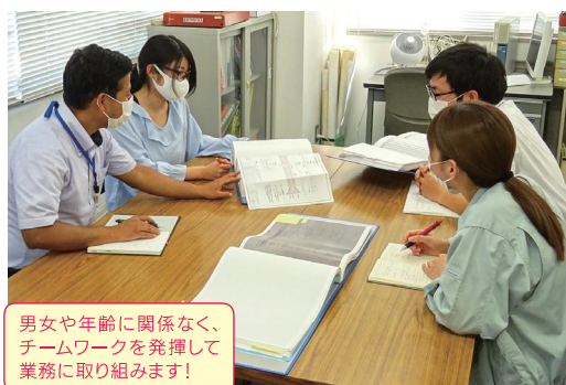
男女や年齢に関係なく、チームワークを発揮して業務に取り組みます！

社員旅行やBBQ、スポーツ大会など行事もたくさん開催されており、先輩や同僚にも相談がしやすい、和気あいあいとした雰囲気です。