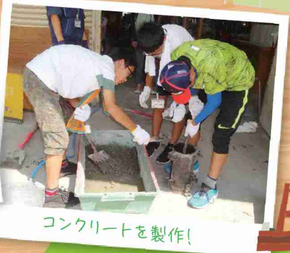
コンクリートを製作!