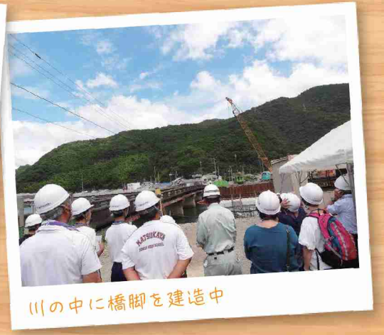
川の中に橋脚を建造中

建設機械の操作体験など、 あまり経験のできないこと ができ、とてもいい経験が できたと思います。進路 選択も少し考えようと思 いました。