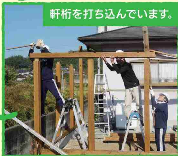
軒桁を打ち込んでいます。