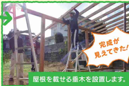
完成が見えてきた!