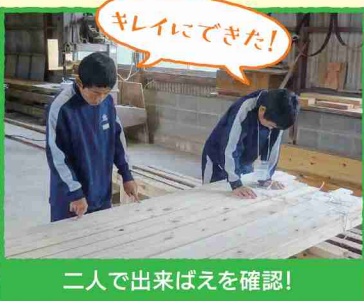
二人で出来ばえを確認!