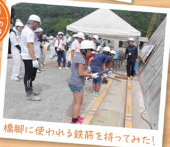
橋脚に使われる鉄筋を持ってみた!