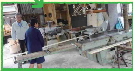
大きな機械で下地材を削って、厚さを統一。