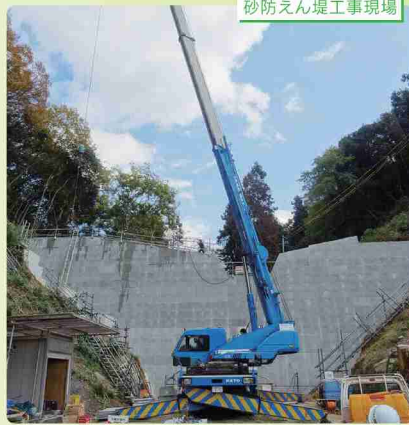
砂防えん堤工事現場

私が一から施工に携わっている現場で、今年の大雨で再び土石流が起きるなど、いろいろと苦労していますが、地元の方々の安心・安全を守るため、完成に向け、頑張っています。