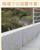
現場での測量作業!