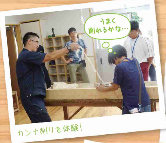
カンナ削りを体験!