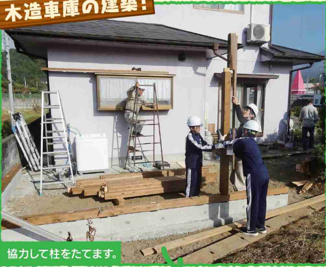
協力して柱をたてます。