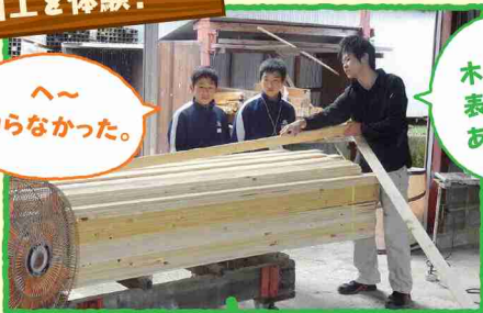
木材には表と裏があるんだよ!