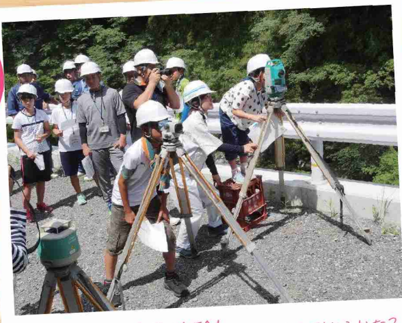
測量機械の操作体験! ちゃんと測れるかな?

工事現場見学 普段は立入禁止となつて いる工事現場では、実 際に工事を行っている建 設業者の方の説明を受け ながら、道路整備工事や 橋りょう工事を間近で見 学しました。