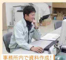
事務所内で資料作成!

ゆくゆくは1級土木施工管理技士の資格を取得して、しっかりと経験を積んで一人前の技術者として会社に信頼されるようになりたいです。 また、地域のために役立つような道路改良工事などにも携わりたいです。