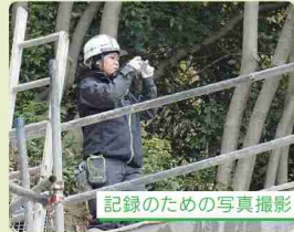
記録のための写真撮影

何もないところからみんなと協力して自分達が一から造り上げたモノが、何十年もそこに残り続けることです。その建造物が地域のためになり、地域の方々からも感謝の声をいただくことができ、とてもやりがいを感じています。