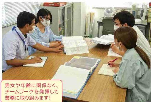
男女や年齢に関係なく、チームワークを発揮して業務に取り組みます!

現在担当している仕事をもっと深めていき、様々な業務に携わりながら知識と新たな資格も取得して、誰からも信頼される女性技術者になりたいです。