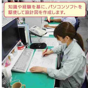
知識や経験を基に、パソコンソフトを使用して設計図を作成します。

入社して一番初めに携わった河川工事の設計の仕事です。初めての仕事ということもあり、分からないことだらけの中、先輩が優しく丁寧に教えてくれましたが、「どうして自分は上手くできないのか」とすごく悔しく、泣きそうになりながら取り組んでいました。