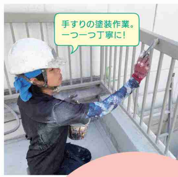
手すりの塗装作業。一つ一つ丁寧に!

塗装の工事が完了した時に、注文者の方から「すごくキレイになったね。まるで新築のようだね。」と褒めていただくと、大きな達成感と喜びを感じます。