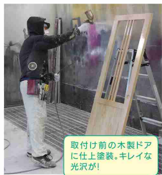
取付け前の木製ドアに仕上塗装。キレイな光沢が!