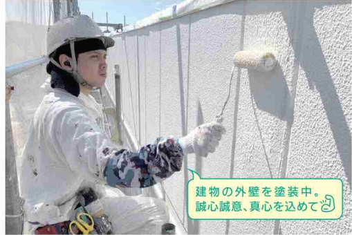
建物の外壁を塗装中。誠心誠意、真心を込めて

皆さんが毎日暮らしている住宅や学校、ビルなどの建物を建築する際の最後の仕上げとして、カラーデザインにより美しく装い、建物を保護するため、外壁や内壁への塗装工事を行っています。