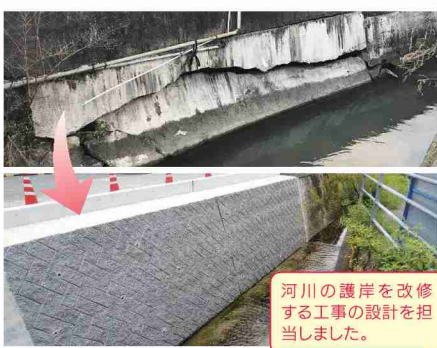
河川の護岸を改修する工事の設計を担当しました。

とても大変でしたが、試行錯誤しながら何とか最後までやり切り、その設計した河川の工事が行われている光景を見たときに、やりがいと達成感を感じて、「これから頑張っていこう」という気持ちになりました。