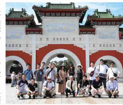
社員旅行やBBQ、スポーツ大会など行事もたくさん開催されており、先輩や同僚にも相談がしやすい、和気あいあいとした雰囲気です。

資格取得のための支援も充実していて、先輩が講師となって行う勉強会や受験費用の負担など、就職後のキャリアアップに対して手厚く支援してくれます。