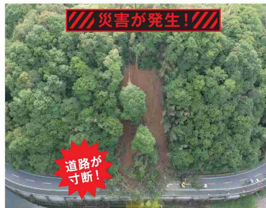
令和2年7月豪雨災害