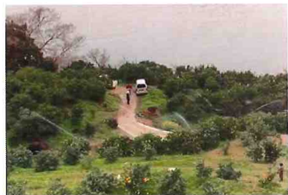
(R3. 3. 16 知永散水状況)