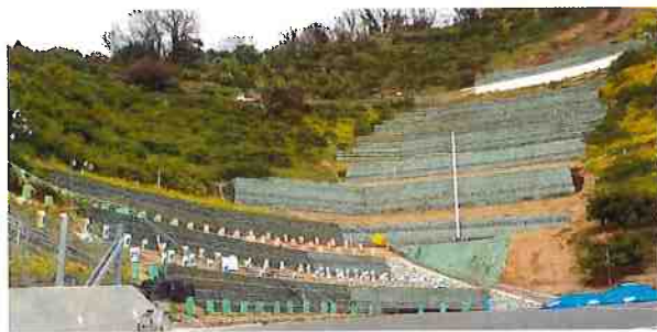
(法花津)R3. 3月植栽完了