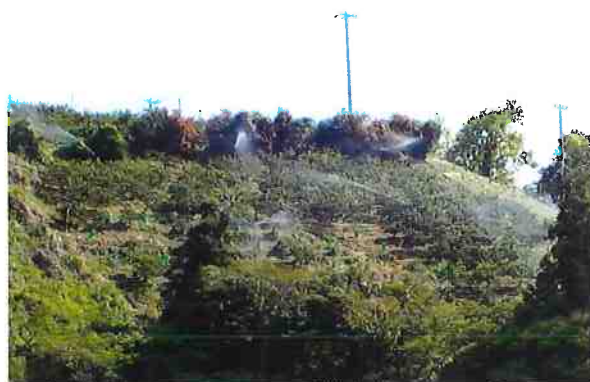
(R3. 4. 15大浦散水状況)