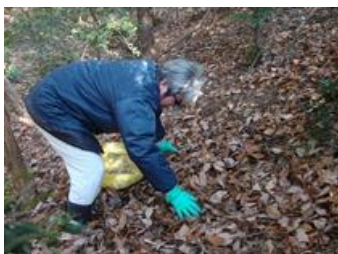
写真1:越冬場所である落葉を採集