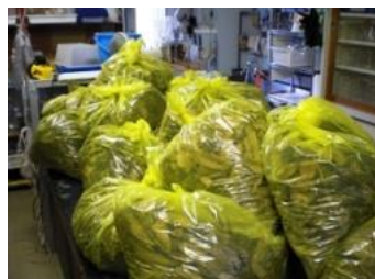
写真2:25℃の室内で飼育