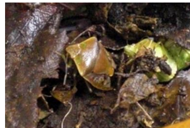
写真3:チャバネアオカメムシ越冬成虫