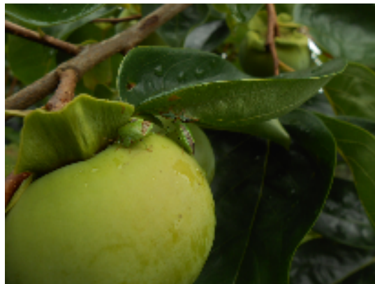
写真1 チャバネアオカメムシのかんきつ(左)、かき(右)への寄生