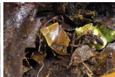
写真3:チャバネアオカメムシ越冬成虫