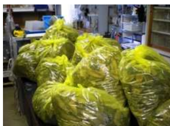
写真2:25℃の室内で飼育中