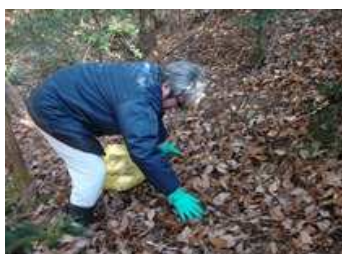
写真1:越冬場所である落葉を採集