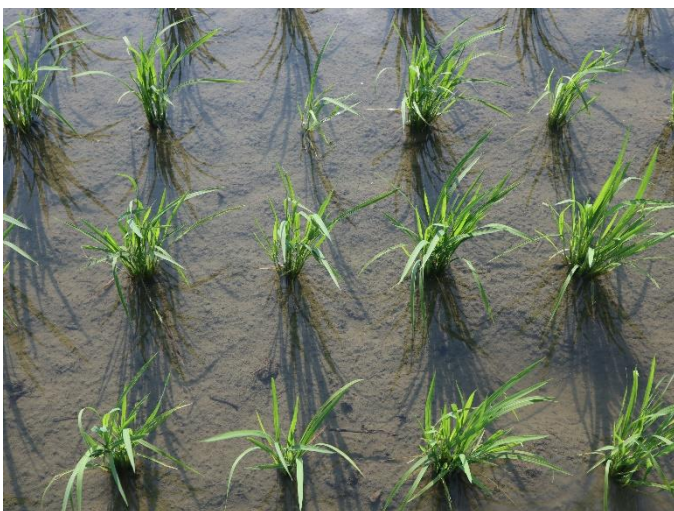
上から (6/15 時点)