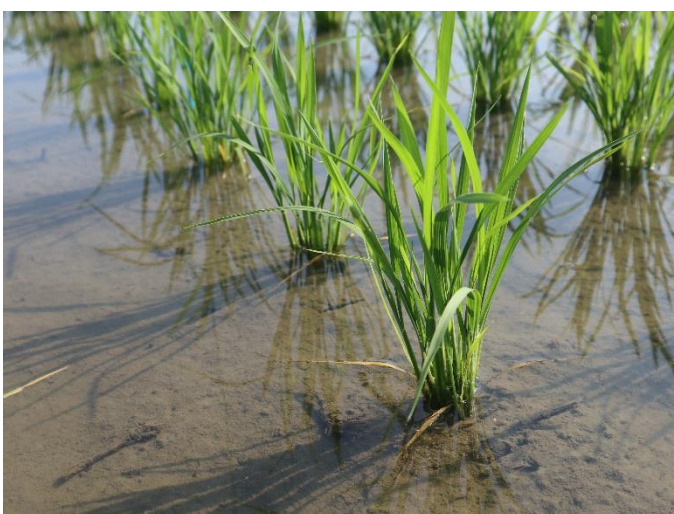
横から (6/15 時点)