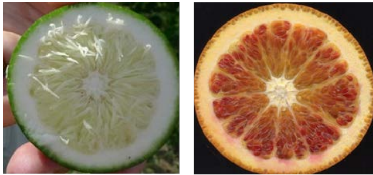
図1 果汁が消失したブラッドオレンジ ‘タロッコ’の果肉赤道部 (左：10月収穫 右：3月収穫) 【10ページ、16ページ】